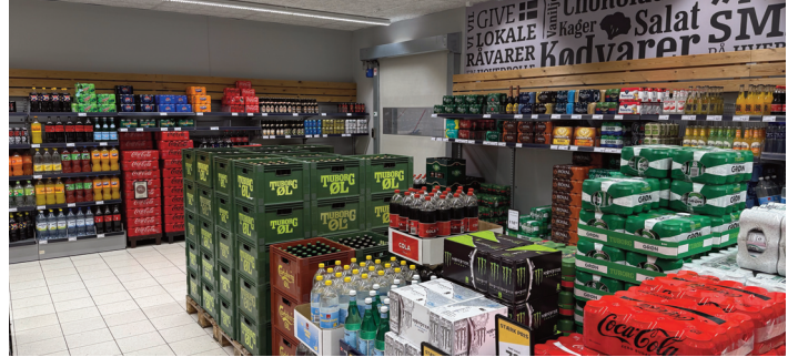
Kaffen er erstattet med andre nydelsesdrikke.