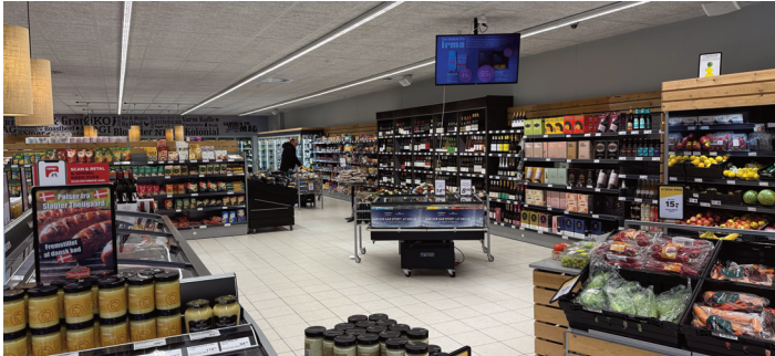
Billeder af Brugsens nye åbne indretning.