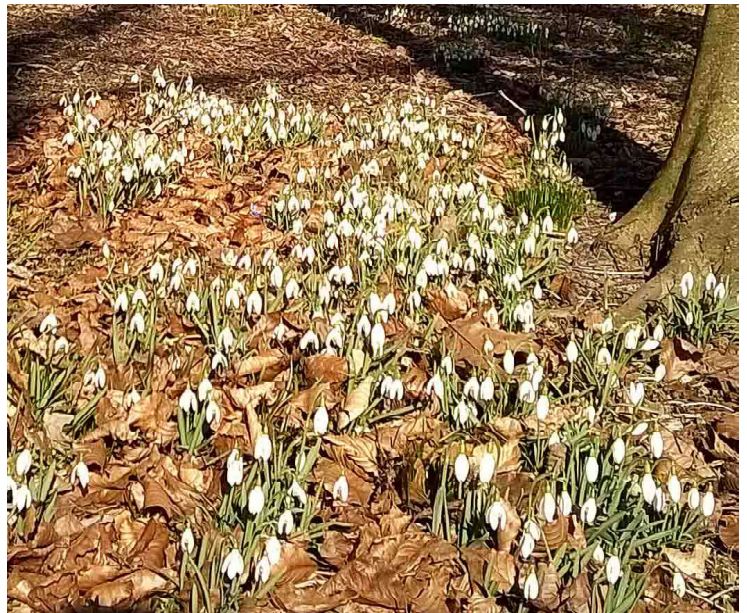
Et kærkomment syn ved volden